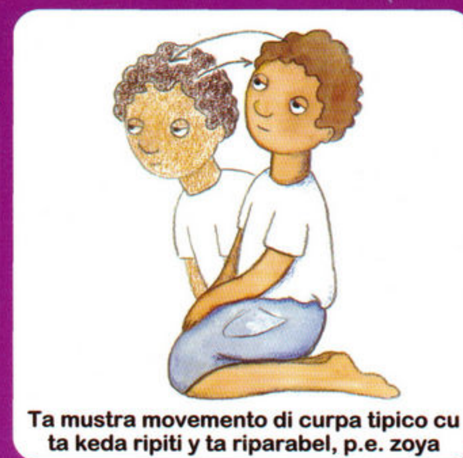
Ta muestra movimiento di curpa tipico cu ta keda ripiti y ta riparabel, p.e. zoya